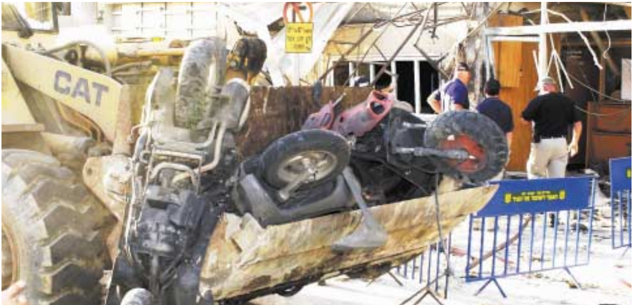
הפינוע הפלילי באלבני.